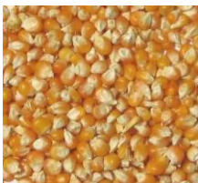
เมล็ดข้าวโพดและข้าวฟ่าง