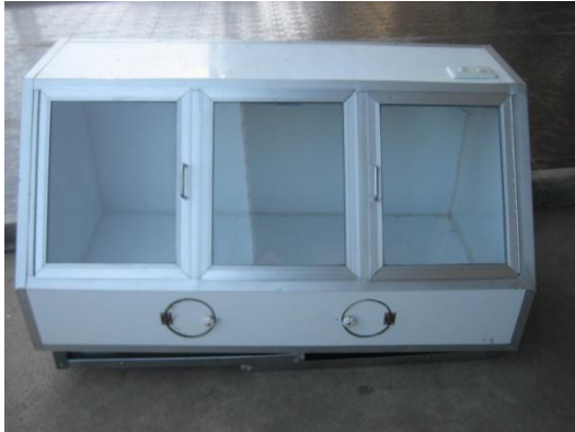
ตู้เชื้อเชื้อรุษขาพับได้พร้อมหลอดฆ่าเชื้อ