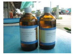
แอลกอฮอล์ 70,95