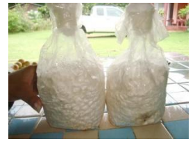
ก้อนเชื้อพร้อมใช้

สนใจติดต่อที่ ห้องหุ้นส่วนจำกัดเกษตรวิรุห์ สอบถามโทร 056-296330 , 081-3243286