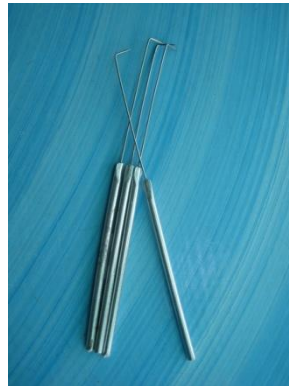
เข็มเขี่ยเชื้อและช้อนตักเชื้อ