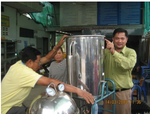
เครื่องกลั่นสมุนไพร