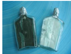
หัวเชื้อในอาหารวุ้น