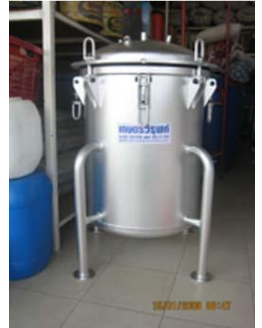
หม้อนึ่งความดันสูงแบบใช้แก๊ส