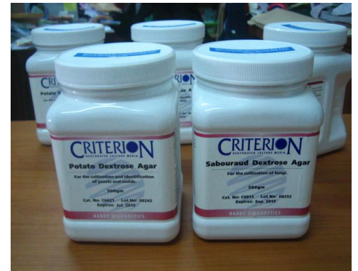
อาหารวุ้นสำเร็จรูป PDA และ SDA