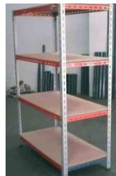
ชั้นวางก้อนเชื้อ