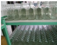
ขวดแบนขนาด 350 ซีซี