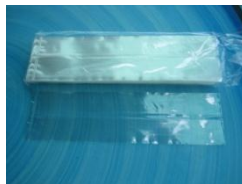
ถุงจีบวัน