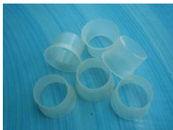
คอขวดพลาสติก