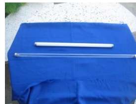
หลอดฆ่าเชื้อ