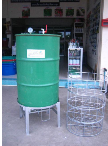
หม้อนึ่งลูกทุ่ง